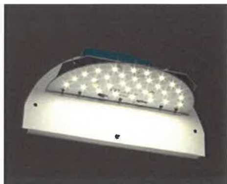
LED-indsats 11 Watt 3000K Ra 80-85, farvekode 830